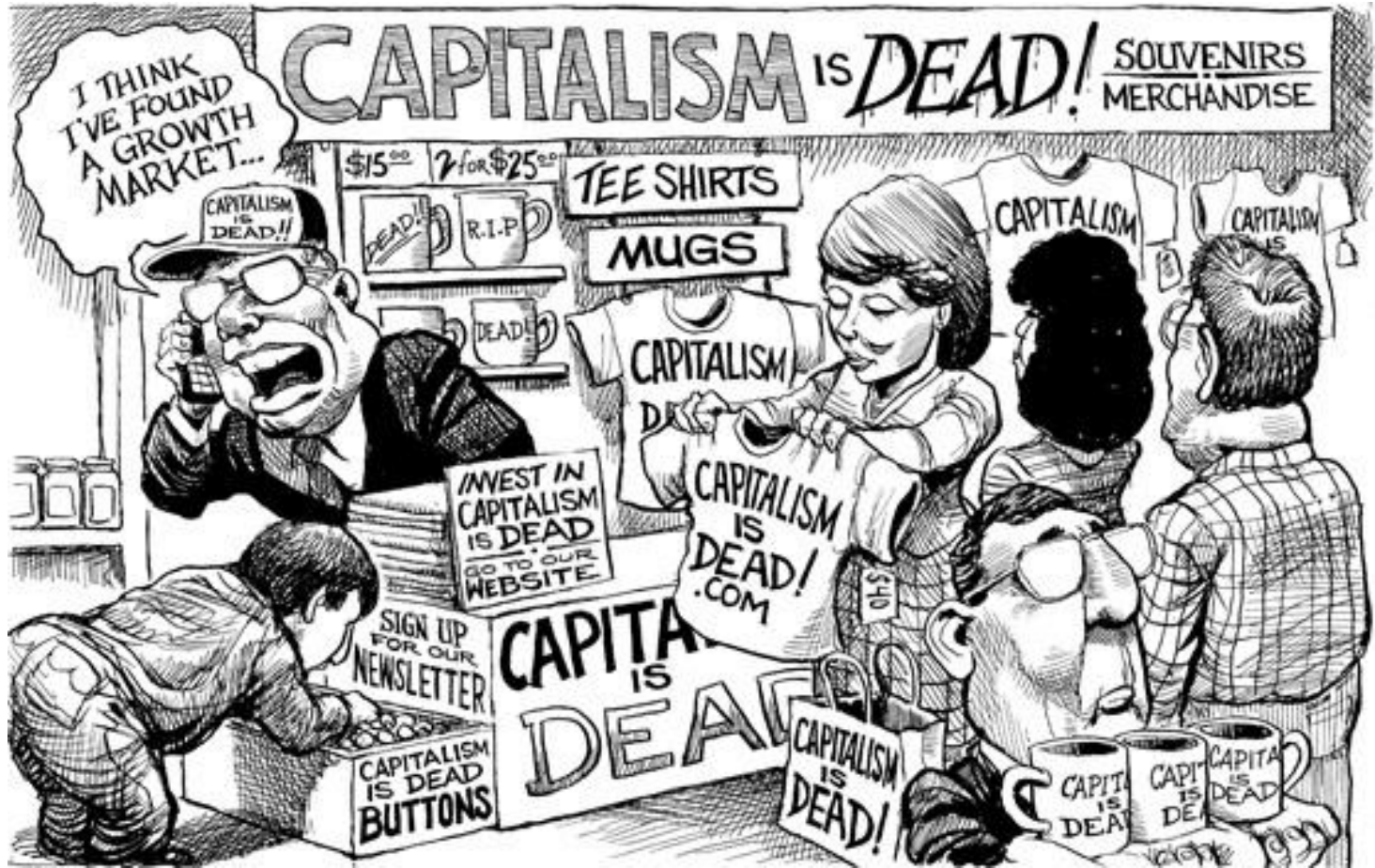
KAL's cartoon 18 octobre 2008 The Economist